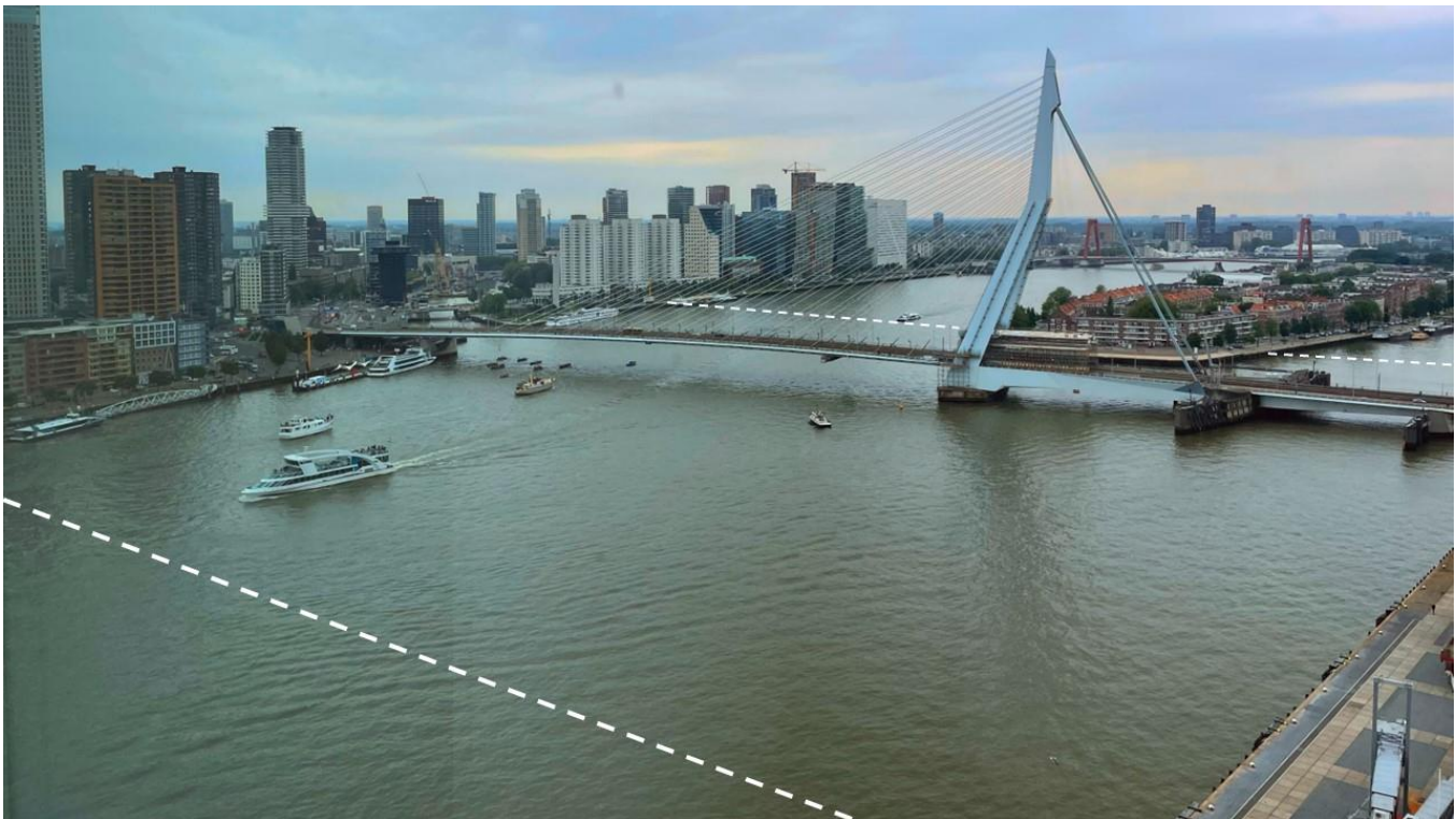
De zone waarin de maximumsnelheid gaat gelden.

Het meest recente incident, een aanvaring tussen een watertaxi en een waterbus in november 2024 , toonde volgens De Vries opnieuw aan dat verscherpte veiligheidsmaatregelen nodig zijn. In 2022 zonk een watertaxi na een aanvaring met een havenrondvaartboot van Spido. De opvarenden van de watertaxi konden net op tijd in veiligheid worden gebracht. De snelheidsmaatregel zal vooral de watertaxi's raken, want zij varen nu maximaal 55 kilometer per uur. Ook Rhib's varen met hoge snelheden onder de Erasmusbrug door. De binnenvaart zal weinig merken van de snelheidsbeperking.